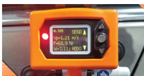
DISPLAY CON LA MEDIDA