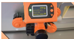
MEDICIÓN RÁPIDA PUERTAS Y PORTONES