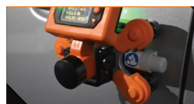
TEST FÁCIL: PEGA, CIERRA, Y PULSA