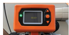
SIMPLE DE CONFIGURAR