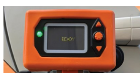
DISPLAY CON LED ROJO/VERDE